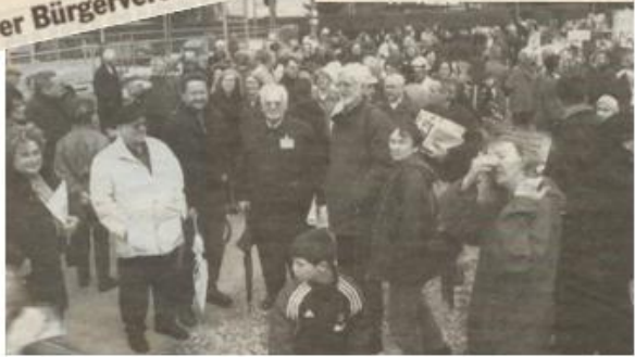
Pressestimmen aus Q3/2002 (Süd-Ost Kuriers, Hallo, Süddeutschen Zeitung, Münchner Wochenblatt und Merkur)